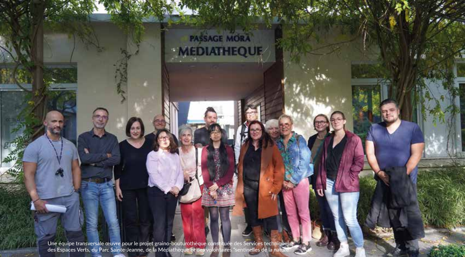
Une équipe transversale œuvre pour le projet graino-bouturothèque constituée des Services techniques, des Espaces Verts, du Parc Sainte-Jeanne, de la Médiathèque et des volontaires "sentinelles de la nature"