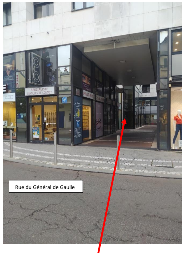
Situation du local

Le local est situé dans un ensemble immobilier en cœur de ville, dans « le village », un des principaux axes commerçants de la ville.